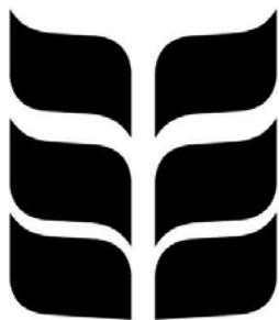
Brot für alle